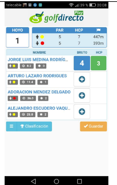
imagen nº 3