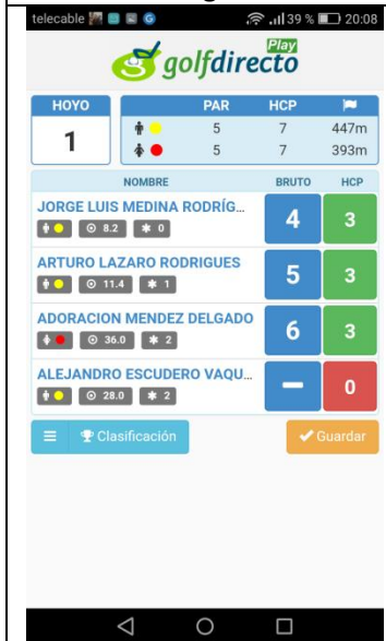
imagen nº 4