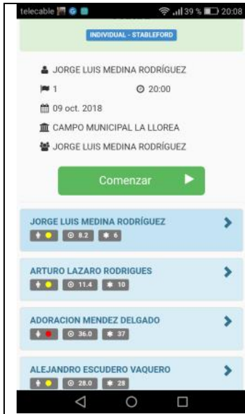
imagen nº 1